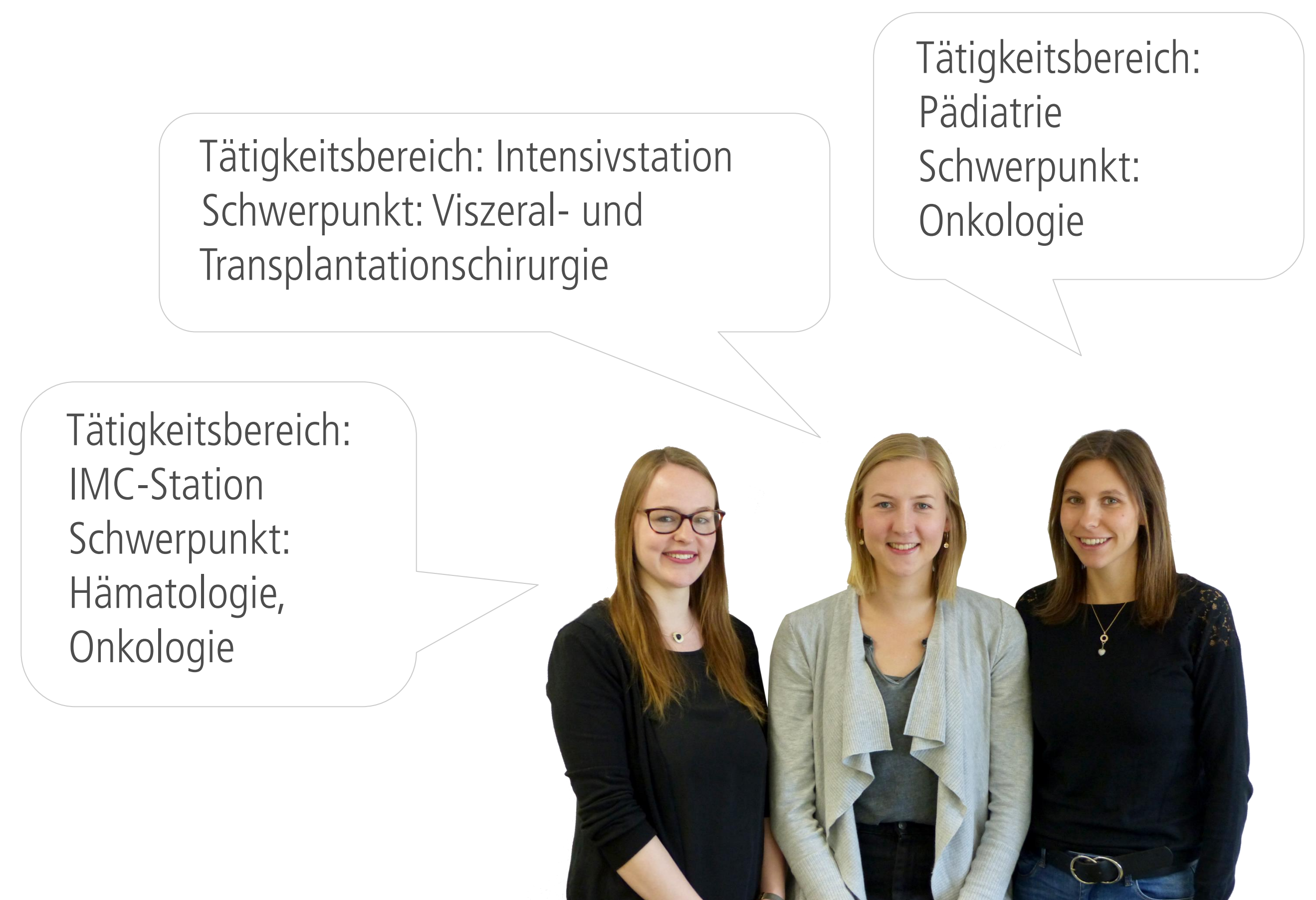
Die ersten drei APN-Trainees

Vor dem Hintergrund der immer komplexer werdenden Versorgungssituationen von Patient*innen im Krankenhaus, ist für die Sicherstellung einer evidenzbasierten Patient*innenversorgung der gezielte Einsatz von akademischen Pflegefachpersonen als Advanced Practice Nurse (APN) notwendig [1]. Derzeit gibt es keine Konzepte wie Studierende auf die APN Rolle vorbereitet werden können. Daher wurde ein APN-Trainee Programm entwickelt, welches Masterstudierende auf dem Weg zur APN besonders in der Rollenfindung und -gestaltung praktisch unterstützen soll.